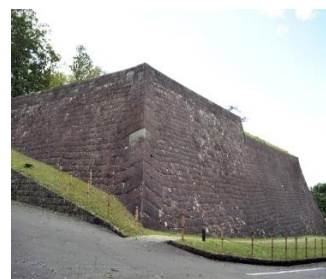
登翔口にある石垣