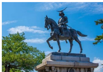
政宗像も震災から立ち直った