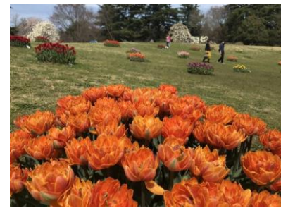
【アイスチューリップ】